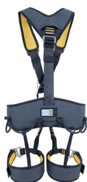
OFF SHORE 无背部挂点全身安全带