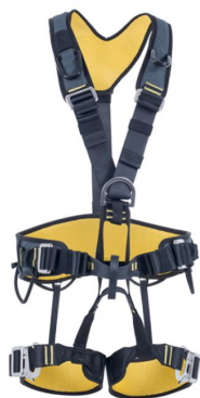
OFF SHORE 无背部挂点全身安全带